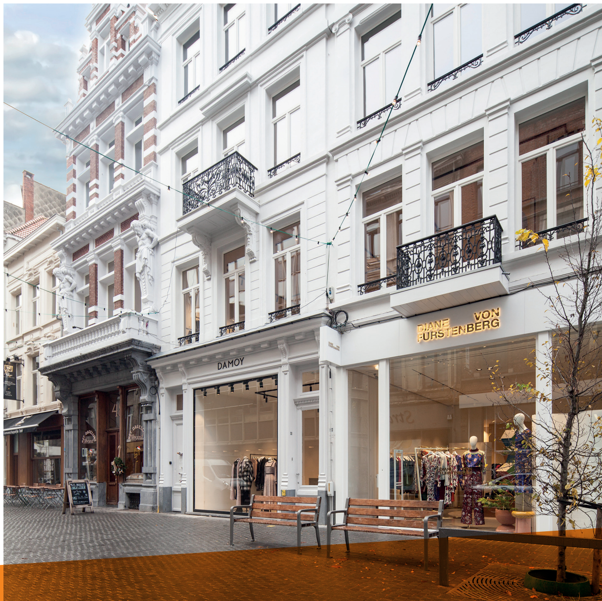
Antwerpen - Steenhouwersvest 44-46-48